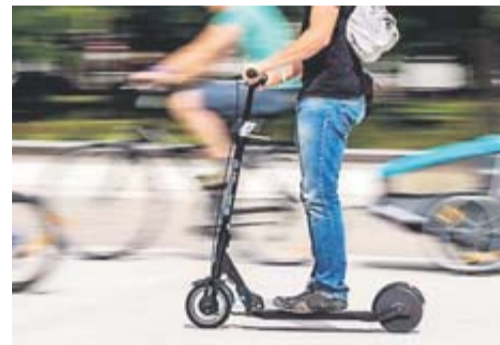
En Allemagne, les trottinettes sont immatriculées.

Les victimes d'accidents liés à ce nouveau mode de déplacement ont été reçues hier au ministère des Transports. Un code de bonne conduite est en préparation. • page 5