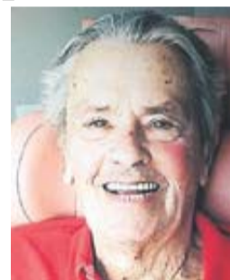
Alain Delon va bien.