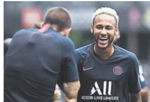
Neymar tout sourire à l'entraînement.

Écarté pour l'ouverture du championnat, conspué par les supporters, le divorce semble consommé entre la star brésilienne et le club parisien. La semaine sera décisive. • page 12