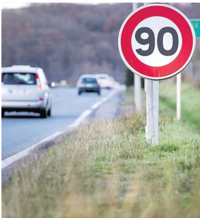
Le retour de la vitesse à 90 km/h ne devrait concerner que certains axes.

Alors qu'il était favorable à un retour généralisé de la vitesse à 90 km/h sur ses 6 300 km de routes, le conseil départemental de Haute-Garonne se montre aujourd'hui plus prudent. Une étude est en cours. • page 7