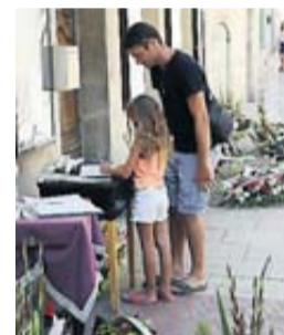
Au village de Signes, l'hommage au maire.

Pris dans une spirale de violence, les maires gardent le soutien de plus de 80 % des Français. Ils expriment en revanche leur défiance à l'égard des parlementaires. • page 5