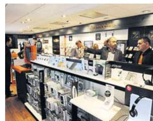
20 000 salariés d'Orange toucheront une prime.

Proposé par le chef de l'État, le versement aux salariés d'une prime de fin d'année fait écho dans les grandes entreprises... Moins dans les PME. • page 6