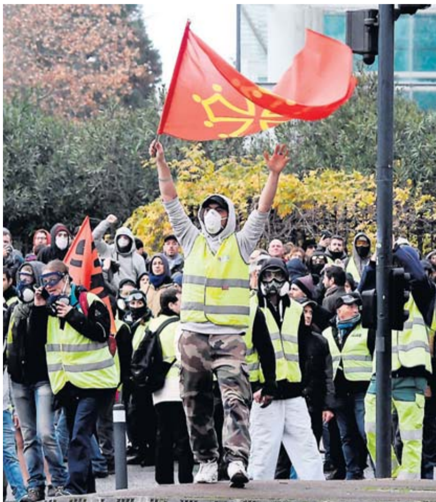
Manif samedi dernier des gilets jaunes et de la Marche pour le climat.

Gilets jaunes, lycéens, syndicats... des manifestations sont annoncées pour vendredi et samedi dans le centre-ville de Toulouse qui vient de connaître deux week-ends de violences. Dans ce contexte, leur maintien fait débat. • pages 20 et 21