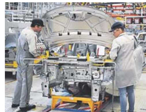
Le secteur automobile, un des piliers du rebond.

ÉCONOMIE Croissance de 0,4 % : quel impact sur l'emploi ?