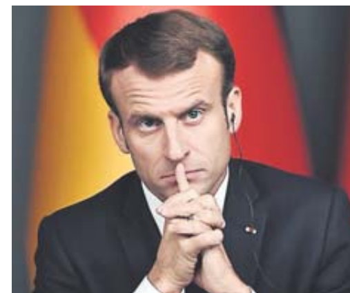
Macron « gère l'effort » selon son entourage.

POLITIQUE Le coup de fatigue d'Emmanuel Macron