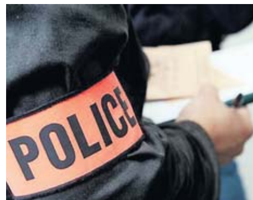
La garde à vue du mineur peut durer 4 jours.

L'adolescent de Montauban est interrogé par l'antiterrorisme, qui suivait depuis un an ses agissements après un signalement de son collègue. • page 7