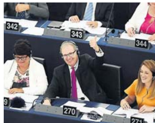
Les députés européens ont entendus les auteurs.

Feu vert pour la réforme du droit d'auteur