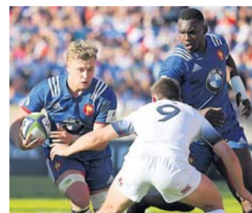
Des petits Bleus qui deviendront grands.

Après avoir battu les Springboks et les Blacks, les Bleuets (-20 ans) en venant hier à bout des Anglais (33-25) sont devenus champions du monde. Une première ! • page 26