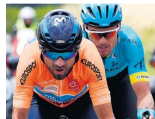
Valverde : tous derrière et lui devant.

L'Espagnol Alejandro Valverde a remporté hier la Route d'Occitanie-La Dépêche du Midi, à l'issue de la 4 e et dernière étape, partie d'Ariège. • pages sports