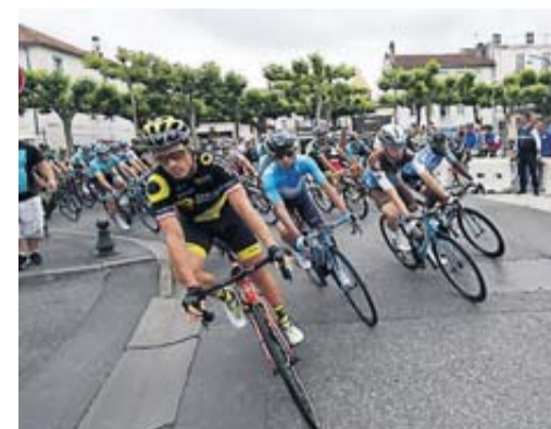
Après Saint-Gaudens Masseube, place aux cols.

Aujourd'hui, l'étape de tous les dangers