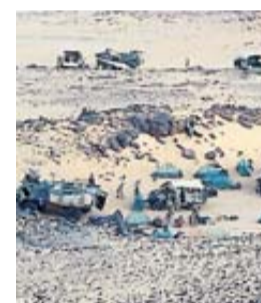
Un camp militaire au cœur du Sahel.