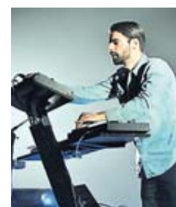
L'électro de Synapson en vedette au Capitole.

Après deux ans consacrés aux stars et à France 2, la Fête de la musique tend à nouveau le micro aux artistes locaux. Plus de soixante-dix concerts sont prévus. • page 21