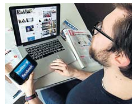
Un texte qui ne fait pas l'unanimité./PQR

Comment lutter contre les fausses infos ?