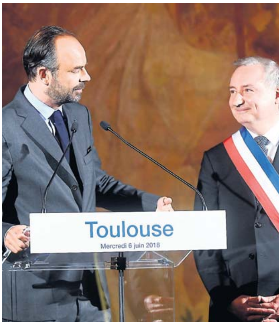
Edouard Philippe a été reçu hier soir à la mairie de Toulouse