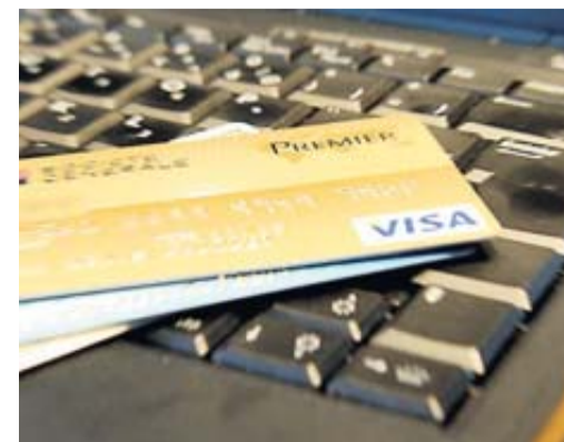
Un mode opératoire difficile à détecter.

Les escroqueries à la carte bancaire explosent