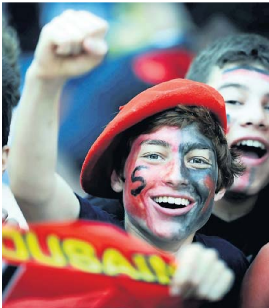
Le club incite les supporters du Stade à arborer les couleurs rouge et noir.

Le match de barrage qualificatif pour la demi-finale de Top14, Stade Toulousain-Castres aura lieu samedi à Toulouse. Pour soutenir les joueurs, le club invite tous les Toulousains à s'habiller en rouge et en noir dès vendredi. • pages 13, 18 et 19