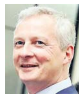
Bruno Le Maire vient débattre avec les Gersois./