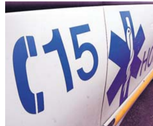
La famille veut savoir ce qu'il s'est passé.

Le parquet de Cahors a ouvert hier une enquête préliminaire après la plainte d'une famille reprochant une intervention trop tardive du Samu. • page 6