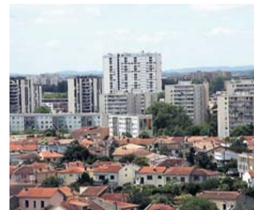
La fin de la TH inquiète les localités.

Si la taxe d'habitation doit être supprimée pour tous d'ici 2020, il faudra trouver des compensations. Un rapport est remis demain au gouvernement. • p.5