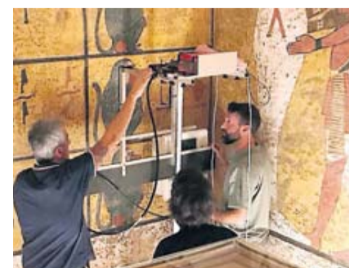
Pas de chambre secrète dans le tombeau.

3 300 ans après la mort du célèbre pharaon, les dernières analyses radars révèlent qu'il n'existe pas de pièce secrète derrière le tombeau du jeune roi. • page 4