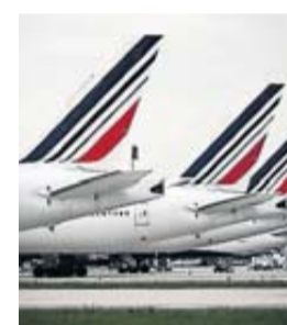
Air France, un fleuron aux pieds d'argile.

Alors que la compagnie nationale connaît son 14 e jour de grève, les inquiétudes grandissent sur les conséquences du mouvement. Air France joue sa survie. • page 6