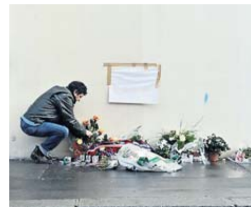
Devant l'immeuble qui abritait le journal à Paris.