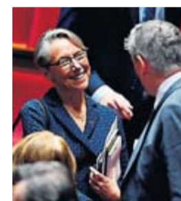
La ministre des Transports, Elisabeth Borne.