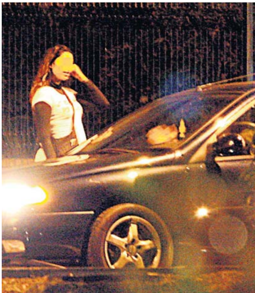
Les associations observent une baisse de la clientèle des prostituées.

Les pratiques des prostituées changent depuis les arrêtés anti-prostitution et la pénalisation de la clientèle. L'association Grizélidis alerte : il y a moins de clients et les travailleuses du sexe sont exposées à davantage de risques. • pages 18 et 19