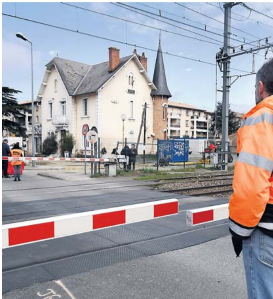
À Muret, le « PN 19 » est définitivement fermé depuis cette semaine.

Réputé dangereux, le passage à niveau 19 de Muret, est fermé pour 18 mois et va être remplacé par un tunnel fin 2019. En Haute-Garonne, une dizaine de passages à niveau sont inscrits au programme national de sécurisation de la SNCF. • p. 18 et 19