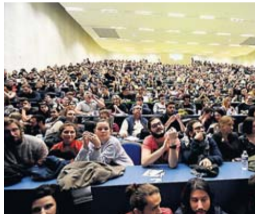
L'université Jean-Jaurès est toujours bloquée.

La ministre dénonce «une désinformation»