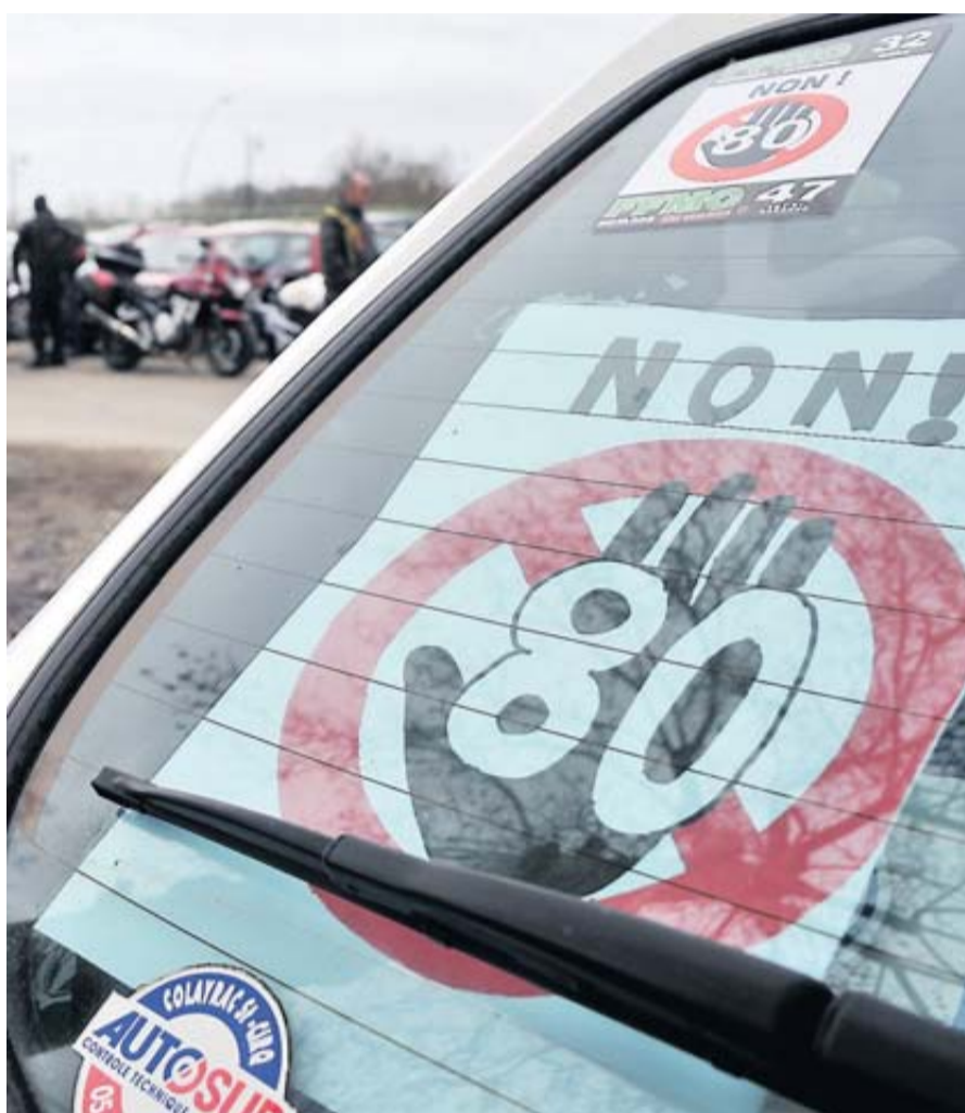
Les élus veulent que la limitation de vitesse soit adaptée à l'état du réseau.

Les élus du conseil départemental de la Haute-Garonne appellent l'État à revenir sur la mesure annoncée de limiter la vitesse à 80 km/h sur les routes. En plaidant pour « des règles efficaces, comprises, admises et respectées ». page 9