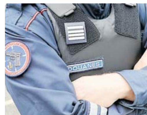
Les douanes françaises dans la tourmente.

Un contrôle des douanes françaises sur le territoire italien a provoqué un couac diplomatique. Gérald Darmanin va se rendre en Italie pour s'expliquer. page 4