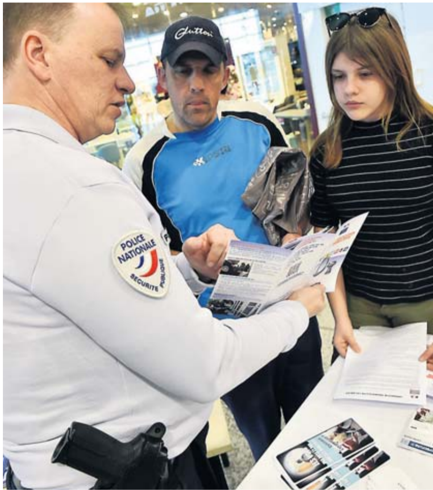
Pour lutter contre les cambriolages, la vigilance du voisinage, ça a du bon...

Baziège, Labastidette, Plaisance-du-Touch... font partie des nouvelles communes de la Haute-Garonne qui adhèrent désormais au dispositif de « participation citoyenne ». Des référents sont désignés pour mieux lutter contre la délinquance. • p.18 et 19