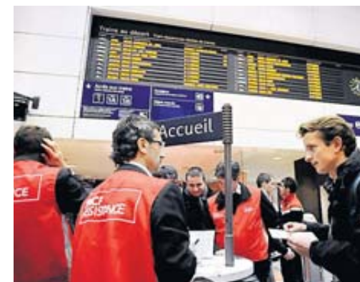
Vers l'abolition des privilèges à la SNCF ?

La direction de la SNCF veut remettre à plat le système de billets gratuits ou à tarifs préférentiels pour les cheminots et leurs familles. • page 5