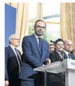
Réunion interministérielle hier, pour la reconstruction.

Emmanuel Macron, accompagné des ministres de la Santé et de l'Éducation, se rend aujourd'hui à Saint-Barth et Saint-Martin. Objectif : rassurer et reconstruire. • p.6