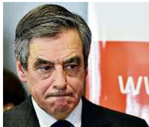
Le visage de moralité de Fillon se fissure.

La défense du candidat de la droite à la présidentielle, hier, après les accusations d'emploi fictif de son épouse, peine à convaincre. Le parquet a ouvert une enquête. • page 4