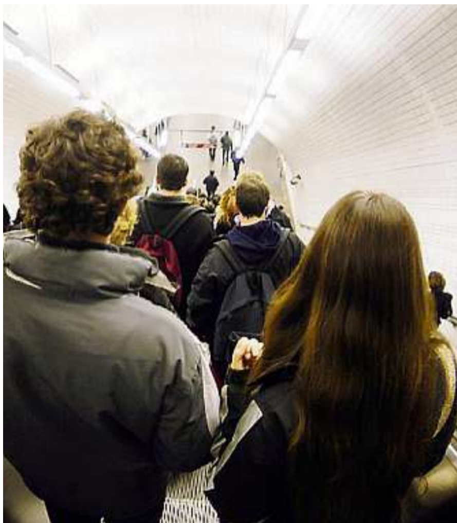
Regards, attouchements... seulement 2 % des victimes osent porter plainte...

PIC DE POLLUTION Vitesse réduite sur les grands axes