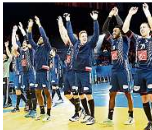
Les Experts visent le titre mondial.

Les Français, qui font figure de favoris, rencontreront ce soir l'équipe de Slovénie en demi-finale des championnats du monde. Leur 11 e en 13 ans. • page 12